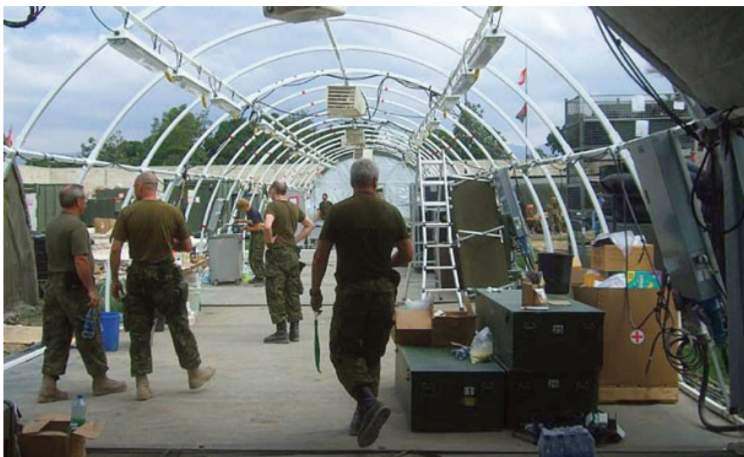
Démantèlement du 1er hôpital de campagne du Canada déployé à Haïti.

Le pharmacien militaire est responsable d'obtenir les équipements médicaux nécessaires. Il faut donc bien comprendre la chaîne d'approvisionnement médicale. En fait, il s'agit là d'une différence marquante entre la pratique militaire et la pratique civile.