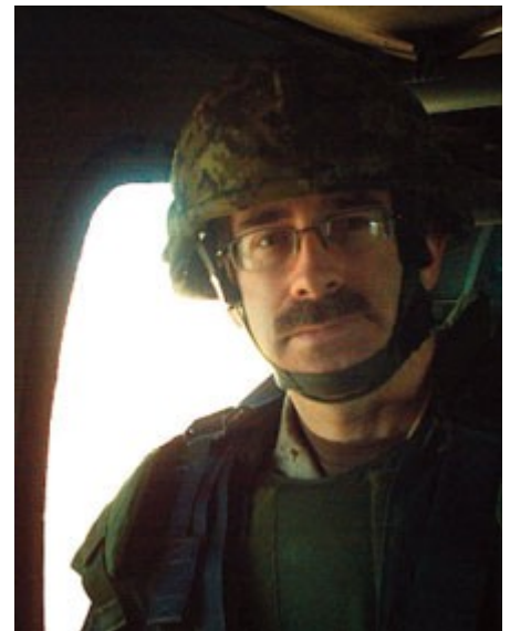
En devoir, près de l'aérodrome de Kandahar, Afghanistan, 2005

Et bien, dans une pratique conventionnelle, en milieu communautaire ou hospitalier, le pharmacien voit des patients et dispense des médicaments. C'est essentiellement ce qui se passe sur la plupart des bases militaires, sauf que vous êtes déplacés d'une affectation à une autre. Cela fait une différence énorme. Un pharmacien militaire doit s'attendre à passer quelques années dans un endroit, puis à déménager. Il faut apprendre à connaître une nouvelle clientèle et s'habituer à de nouveaux milieux. Cela pose des défis notables dans la vie personnelle et familiale, mais vous savez, passer en mode de réinitialisation à tout moment a aussi beaucoup de bons côtés : vous créez de nouveaux liens et vous travaillez avec de nouvelles équipes, ce qui vous aide à jeter un nouveau regard sur la vie, sous tous ses aspects. La vie militaire exige que les gens déménagent régulièrement parce qu'un de ses fondements stipule que vivre de nouvelles expériences aide la personne à grandir en tant que professionnel et à monter dans l'échelle de grades, littéralement. J'aime cette façon de penser.